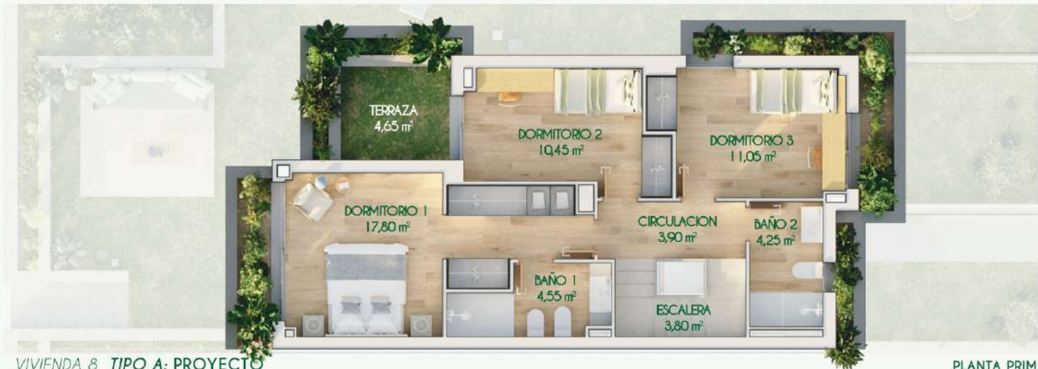
VIVIENDA 8 TIPO A: PROYECTO